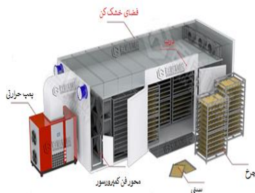
شکل ۶. خشک کن پمپ حرارتی (Fadhel et al., 2011)