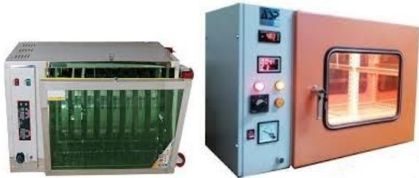
شکل ۵. خشک‌کن مادون قرمز (Pawar and Pratape, 2017)