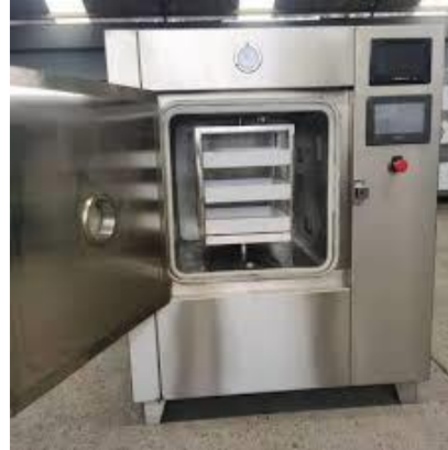
شکل ۱. خشک کن مایکروویو (Shahriar et al. 2022)