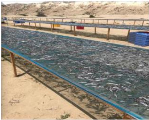
۳- خشک کردن سنتی ماهی با نور خورشید (Boziaris, 2014)