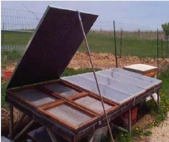
۲- خشک کن ماهی با استفاده از انرژی خورشیدی (Boziaris, 2014)